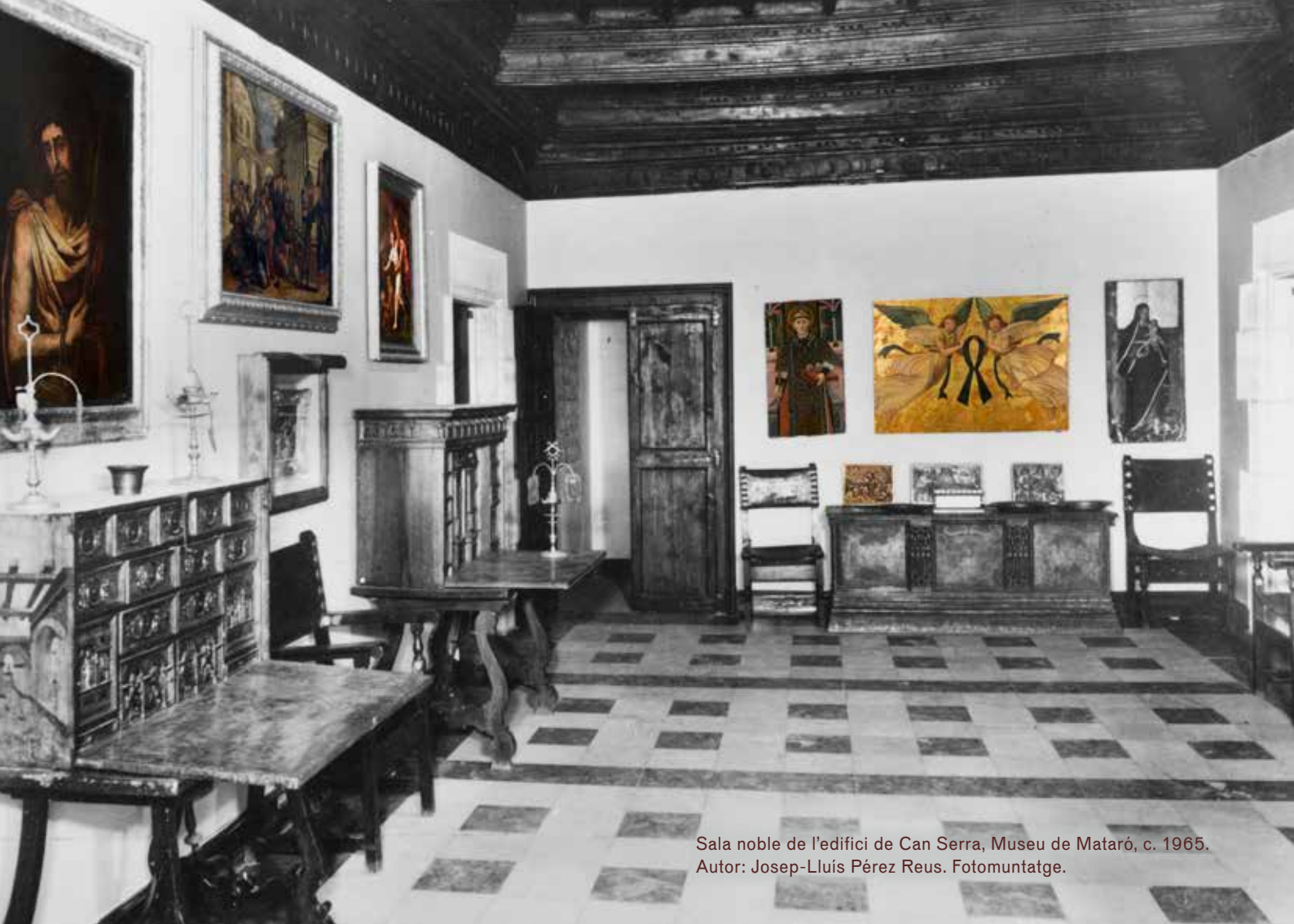
Sala noble de l'edifici de Can Serra, Museu de Mataró, c. 1965. Autor: Josep-Lluís Pérez Reus. Fotomuntatge.